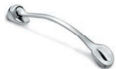
Carriere® Motion™ Klasse II (Edelstahl)

Blau, Pink, Grün, Gold oder Bunt – zwischen diesen fünf trendigen Farben können sich junge Patienten entscheiden. Darüber hinaus steht die Apparatur im klassischen Edelstahl zur Verfügung.