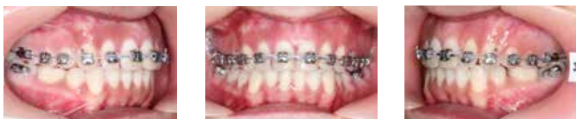
Weiterbehandlung mit Carrière SLX Brackets.